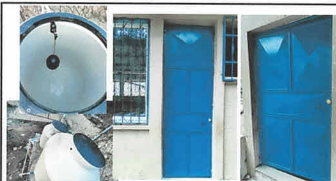
Foto 5: Sustitución de Accesorios y tapadera para tinacos, instalación de puertas de metal.