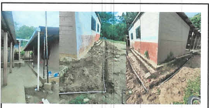
Foto 6: Instalación de Canal de metal con bajadas de agua pluvial e instalación de tubería pvc línea principal hacia servicios sanitarios.

Observación: Si es necesario se pueden agregar hojas adicionales y actualizar el número de hojas.