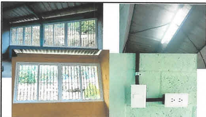
Foto 3: Instalación de Ventanas de PVC e instalación de Sistema eléctrico.