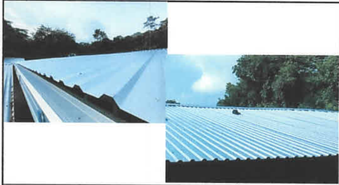
Foto1: Lámina troquelada y Capote